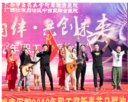
贵康弘支部歌舞《歌武青春》