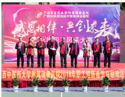
学校及医院领导向全体职工拜年