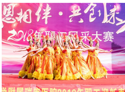
护理部开场舞《盛世欢歌》