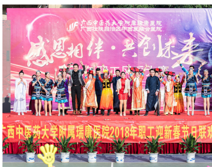
教务学生党总支情景剧《飞跃新马泰》