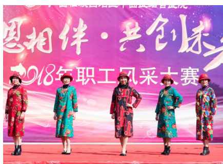
离退休党总支时装秀《小小民族风》