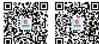
医院官方微信订阅号 医院官方微信服务号

◎ 第 81 期 2018 年 02 月 15 日 主办：广西中医药大学附属瑞康医院 广西壮族自治区中西医结合医院 咨询：0771-2188308/2183018 官网：www.gxrkyy.com ◎