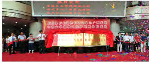
隆重的揭牌仪式掀开了广西在肝胆肠外科研究的新一页

2011年6月27日上午，“卫生部肝胆肠外科研究中心广西基地”在广西中医学附属瑞康医院正式揭牌成立。这标志着广西在肝胆肠外科的研究向更深层次、更高领域发展，广西的人民群众在区内就能享受到国内一流的医疗服务。