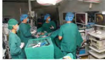
湘雅医院专家在广西基地进行手术指导

随后，卫生部肝胆肠外科研究中心广西基地、中南大学湘雅医院肝胆肠外科基地签约仪式、揭牌仪式在热闹的氛围中举行，掀开了广西在肝胆肠外科研究的新一页。