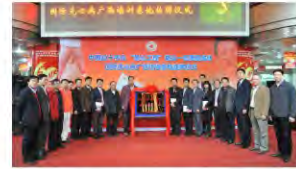
国际先心病广西培训基地挂牌仪式

下午，胡大一教授在我院心血管一区进行教学查房，为患儿进行检查，并进行了病例讨论。