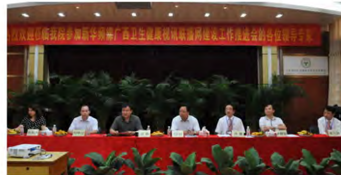
新华频媒广西卫生健康视讯网工作推进会在瑞康医院召开

医院成为新华频媒广西卫生健康视讯联播网的首家试点单位，并取得成功，成为全区医院学习参观的样板，标志我院宣传工作再上新台阶。中央电视台《中华医药》二度报道我院消化内科中西医结合治疗消化疾病的疗效，引起强烈反响。