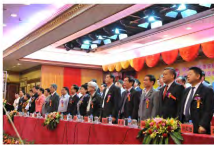
出席庆典的领导嘉宾