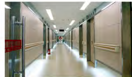
全区最大设备最先进的内镜中心