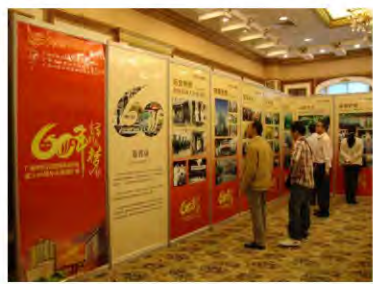
院庆画展吸引了众人