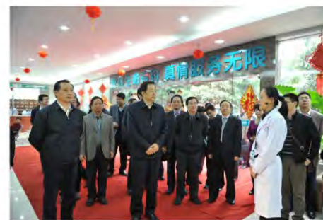
孙志刚一行在听南棉社区卫生服务中心的情况介绍

2011年3月30日上午，国家发改委副主任、国务院医改办公室主任孙志刚，国家发展改革委社会发展司司长任伟，国家发展改革委社会发展司副处长李瑶光一行莅临我院南棉社区卫生服务中心就广西深化医药卫生体制改革工作进行调研。