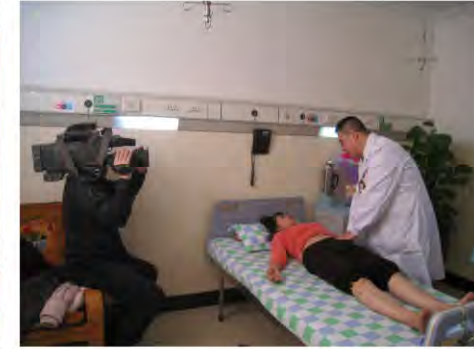
中央电视台采访我院消化内科为病人诊治过程