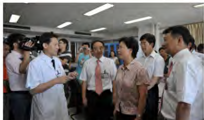
原自治区党委副书记陈际瓦视察消化内科

医院消化内科、骨伤科获得国家重点临床专科，卫生部肝胆肠外科研究中心广西基地胃肠、肝胆外科获得国家重点学科，医院学科建设又取得标志性成果。