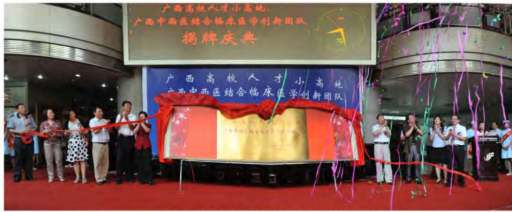
领导和嘉宾为“广西高校人才小高地”揭牌

我院聚集了中西医结合优秀人才，为中西医结合事业的发展做出了积极的贡献。人才小高地落户我院，将会在加快我院高层次领军人才聚集，加快人才培养，完成高水平科研项目，推动重点学科发展、博士点建设等方面发挥重要的作用，进一步推进我院创建“南疆名院”的进程。