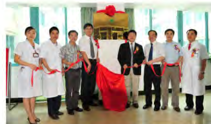
精英团队带领卫生部肝胆肠外科广西基地走向更辉煌的明天