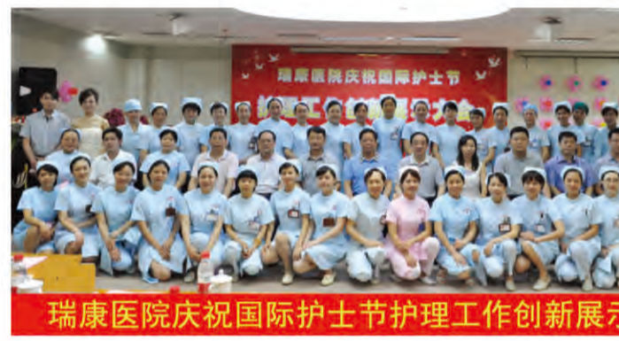
瑞康医院庆祝国际护士节护理工作创新展示大会