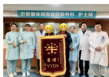
患者向肝胆腺体周围血管病外科医护团队送锦旗

状腺手术治疗效果是一样的，甚至腹腔镜手术优于开放手术，只是需要成熟的腹腔镜手术技术和相对较长的手术时间。广西中医药大学附属瑞康医院肝胆腺体周围血管病外科肝胆腺体外科专家团队具有雄厚的腹腔镜手术技术与丰富临床经验。