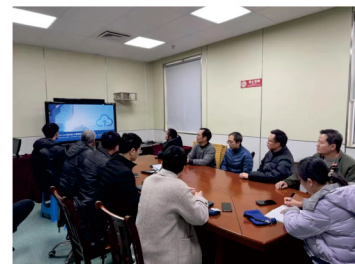
信息网络中心组织DeepSeek智能AI搭建方案