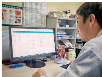
临床医生在体验DeepSeek智能AI辅助系统

未来，广西中医药大学附属瑞康医院将继续以DeepSeek智能AI为核心驱动力，不断深化其与医院各业务系统的结合，探索更多应用场景，致力于打造一个更加智慧、高效的医疗服务体系，推动医学科技创新与突破，促进医院高质量发展，为广大患者提供更加优质的医疗服务。