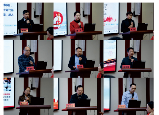
党（总）支部书记作汇报

高宏君强调，在肯定成绩的同时，我们也清醒地看到，医院基层党建工作仍存在一些不足，为此他提出以下四点要求：一是要坚持把党的政治建设摆在首位，增强基层党组织的战斗堡垒作用；二是要持续推进党支部“五基三化”建设，推动基层党建全面进步、提质增效；三是要积极开展党支部品牌创建，打造一批独具特色的党建品牌；四是要从严从实抓好巡视整改、审计整改，纵深推进全面从严治党，营造风清气正的政治生态。希望大家继续以习近平新时代中国特色社会主义思想为指导，不断探索党建与业务融合的新途径、新方法，以高质量党建引领医院高质量发展，推动医院中心工作与医院第三次党员代表大会重点任务深度融合，展现更大作为，为加快建设人民满意的高水平国家中西医协同“旗舰”医院提供坚强的政治、思想和组织保障。（张佳婕）