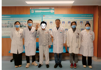
周大叔与医疗团队合影

周大叔腹部仅有5处分别长约0.5厘米—1.2厘米的手术切口，术后9天便完全康复并于1月16日顺利出院。